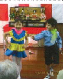
かわいい保育園児ににっこり！