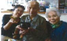
自分で抹茶を立てました。