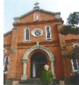
行砂教会に お祈りにいきました