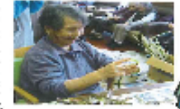
慣れた手つきでつわの皮が出来ました