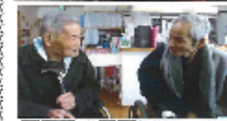
同級生の訪問ににっこり