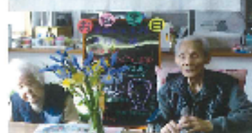
お誕生日おめでどうございます