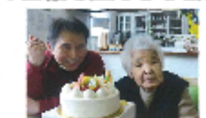
お誕生日おめでどう ございます。