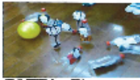
保育園と一緒に ゲームをしてみました！