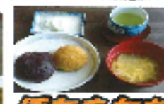
ほたもちを 頂きました