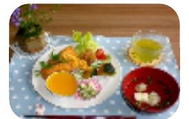
父の日の お祝い御前