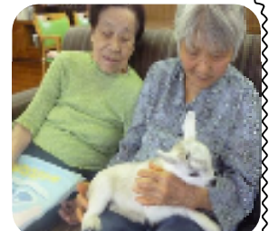
小さなお客様と小ヤギが遊びに来ました