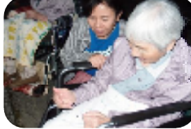
有川の 堂の里に 行きました