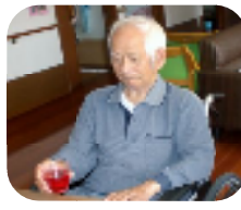
さっぱりで 美味しく できました