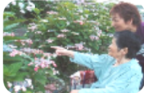
きれいな あじさい みつけました