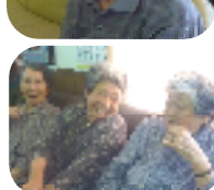
大笑い、大拍手のひと時を過ごしました